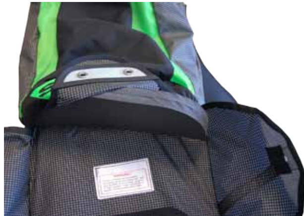
a. Glisser la plus large cale (A) dans le flap supérieur de la poche parachute.

Le Kit envoyé par le SAV SUPAIR contient deux cales : la plus grosse (cale A) sera installée dans le flap du haut de la poche parachute. La plus petite, (cale B) sera installée dans le flap du bas.