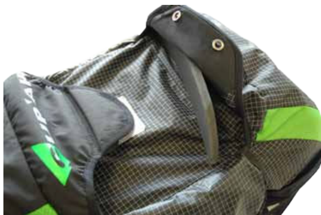
b. Glisser la plus fine cale (B) dans le flap inférieur de la poche parachute.